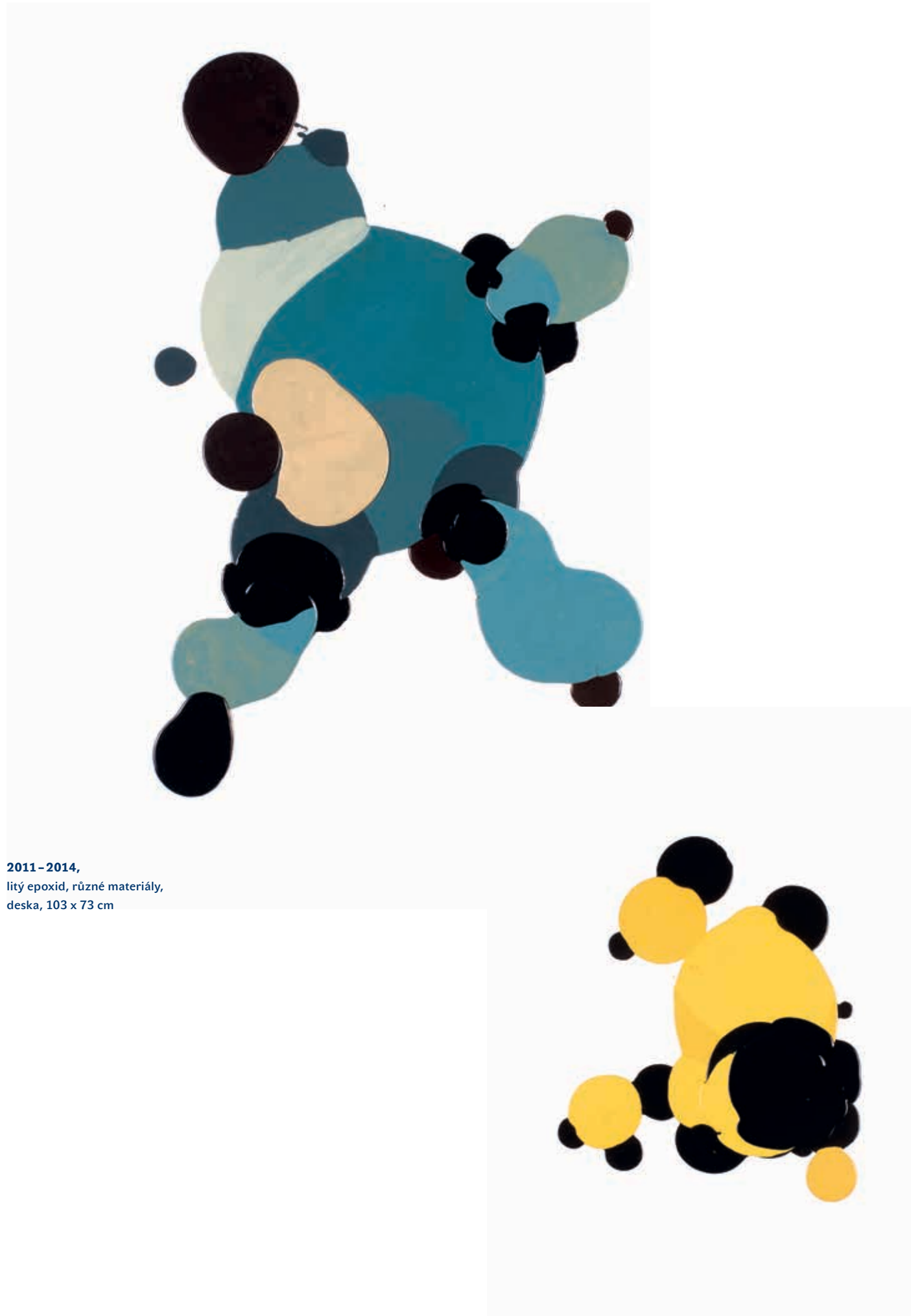
2011–2014, litý epoxid, různé materiály, deska, 103 x 73 cm

kruhových forem. Také v tomto případě lze najít jejich předobrazy v Kinterově prostorové tvorbě, jedním z nich může být např. objekt sněhuláka z deformovaných gymnastických míčů, jehož název Basic Atomic (2011) jasně odkazuje jak k atomické podstatě tak ke skladebnému principu. Zřejmě nejvýrazněji tyto zásady Krištof Kintera sochařsky rozvinul ve svém čtyřapůlmetrovém objektu z plastových vánočních koulí Démon růstu ( Demon of the Growth , 2012), který se otiskl také do plošné tvorby, když stejný materiál v několika případech použil i pro skladebné kompozice na kartonech, ať už byla jejich námětem abstraktní molekulární sestava nebo sváteční záblesk reality, v tomto případě penis. Zvláštní obrazovou skupinu, která rovněž pracuje s předměty denní potřeby, tvoří Plastic Bags (2011), neboli v ploše muchlané plastové nákupní tašky. Také to je téma, které s tvorbou Krištofa Kintera rezonuje už léta. Stačí připomenout audioobjekt I'm sick of it all! z roku 2003 a především Black Flag (2011), který se sérií muchláží bezprostředně souvisí. Také tady hraje roli fascinace lapidárností techniky i efemérností a bezcharakterností výchozího „sochařského“ materiálu, který ochotně přijímá tvar čehokoli, co je do něj vloženo.