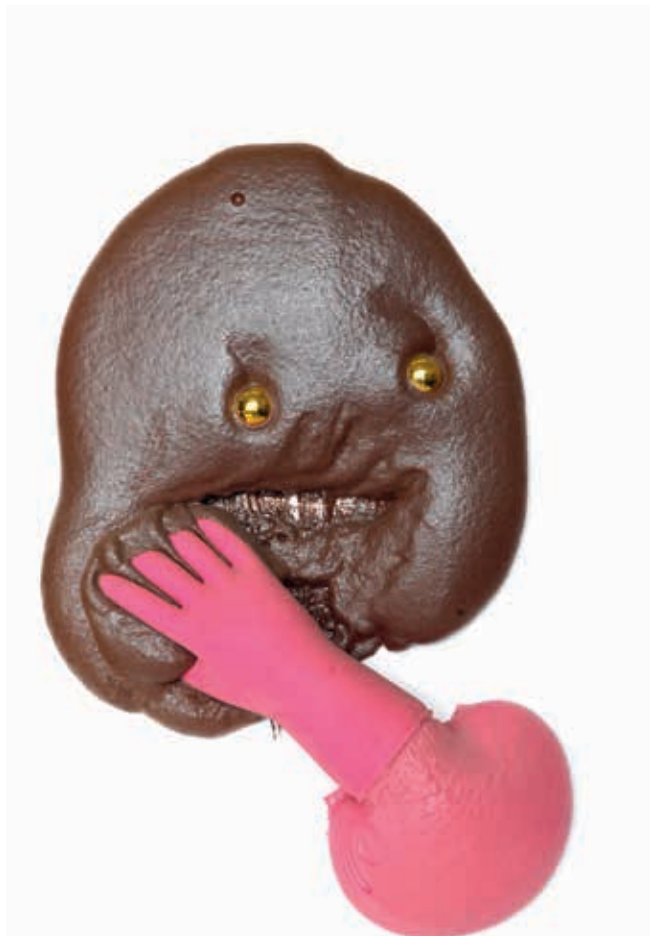
2011–2014, litý epoxid, různé materiály, deska, 103 x 73 cm

i karton. Tematicky hraje hlavní roli jedna nebo více abstraktních skvrn. Ta je zpočátku prioritně vnímána materiálově jako jakási alegorie prahmoty – temná hmota (Dark Matter), v případě většího počtu pak vztahově, což někdy odráží také názvy. Zároveň se už v této fázi objevují zárodky motivu tváří ve formě bazálních lineárních emotikonů bez obrysových kontur umístěných přímo do čisté plochy podložky. Právě v této otevřené řadě, kterou rozvíjel i v následujících dvou letech, Krištof Kintera definoval prakticky všechny určující principy svých „sošných“ kreseb – totiž kombinování novodobých sochařských materiálů včetně vědomého zdůraznění jejich významu s akčními litými technikami, z něhož vychází výrazová exprese a reliéfní plnost kompozice, to vše postupně vázané na tradiční sochařské téma