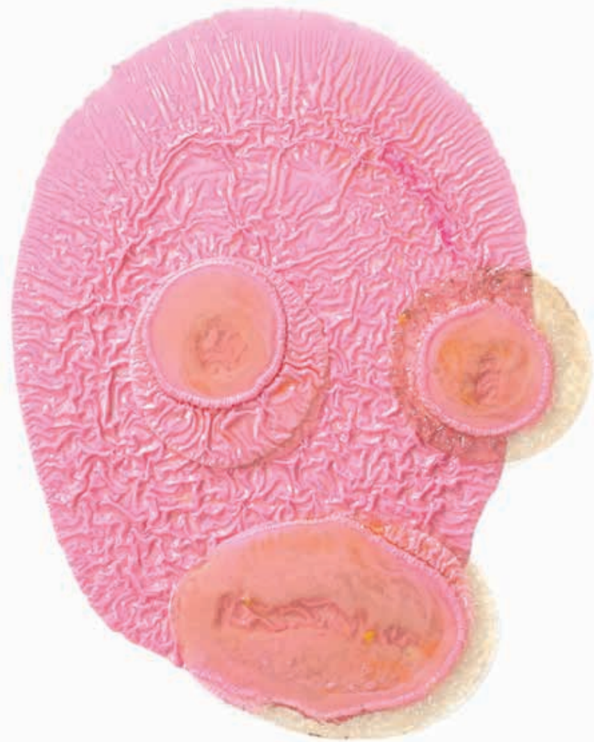
2011–2014, litý epoxid, různé materiály, deska, 103 x 73 cm